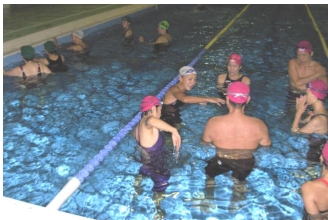
写真上から、指導員養成研修会の練習模様。熱心に聞き入る受講生の皆さん。（杉十小プール）