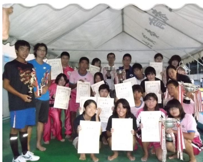
第65回 杉並区区民体育祭夏季大会 優勝校、優勝チームのみなさん。 (和田堀公園プール)