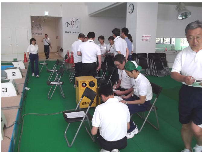
大会競技前、各部署で入念な打ち合わせ。

大きな事故やけが人を出すことなく終了した大会ですが、リニューアル後のプールサイド床面が、以前より滑りやすく、安全対策の必要性を感じました。（3頁へ→）