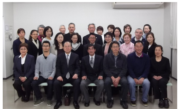
平成24年度総会後 4月21日(土)

※上記事業計画は、日程等変更になる場合があります。 詳細は、広報「すぎなみ」に記載されます