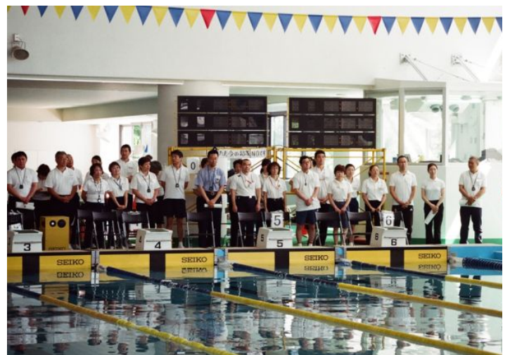
大会開会式、競技役員整列。