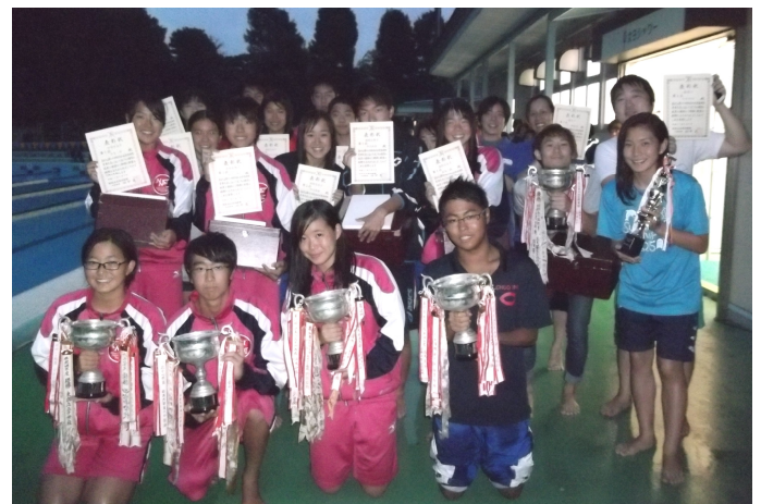
入賞校、学校・民間団体、優秀選手の皆さん。大会新記録は、30個でした。