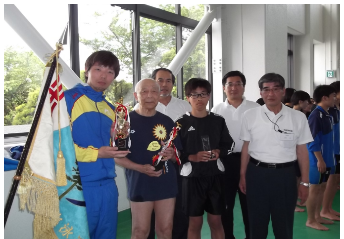
2015 ジュニア・マスターズ水泳大会受賞者の皆さん