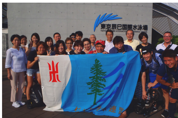
2015 東京都民水泳大会・8月9日(日) 杉並区選手・応援団の皆さん 於 東京辰巳国際水泳場