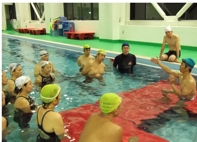
三澤講師（右）による水泳教室指導上の安全・注意点 （於：高井戸温水プール）