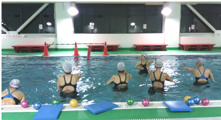
指導員実技研修会 アクアビクス 高井戸温水プール