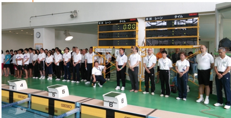
ジュニア・マスターズ水泳大会 競技役員の皆さん 於：高井戸温水プール