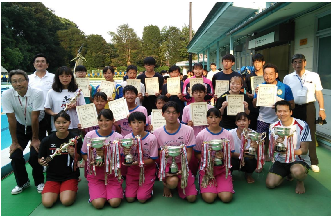
第 72 回 杉並区民体育祭・夏季大会水泳競技会 優勝団体・優秀選手賞 受賞された皆さん。 於：和田堀公園プール 9 月 1 日(日)

令和の時代も 2 年目を迎え、区民の皆様の健康と幸せを祈念いたしましてごあいさつとさせてい たいただきます。今後とも、杉並区水泳連盟をよろしくお願い申し上げます。