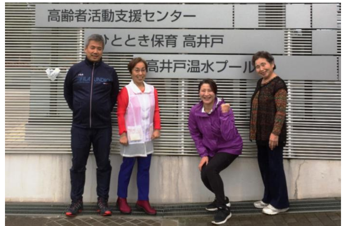
体育の日イベント