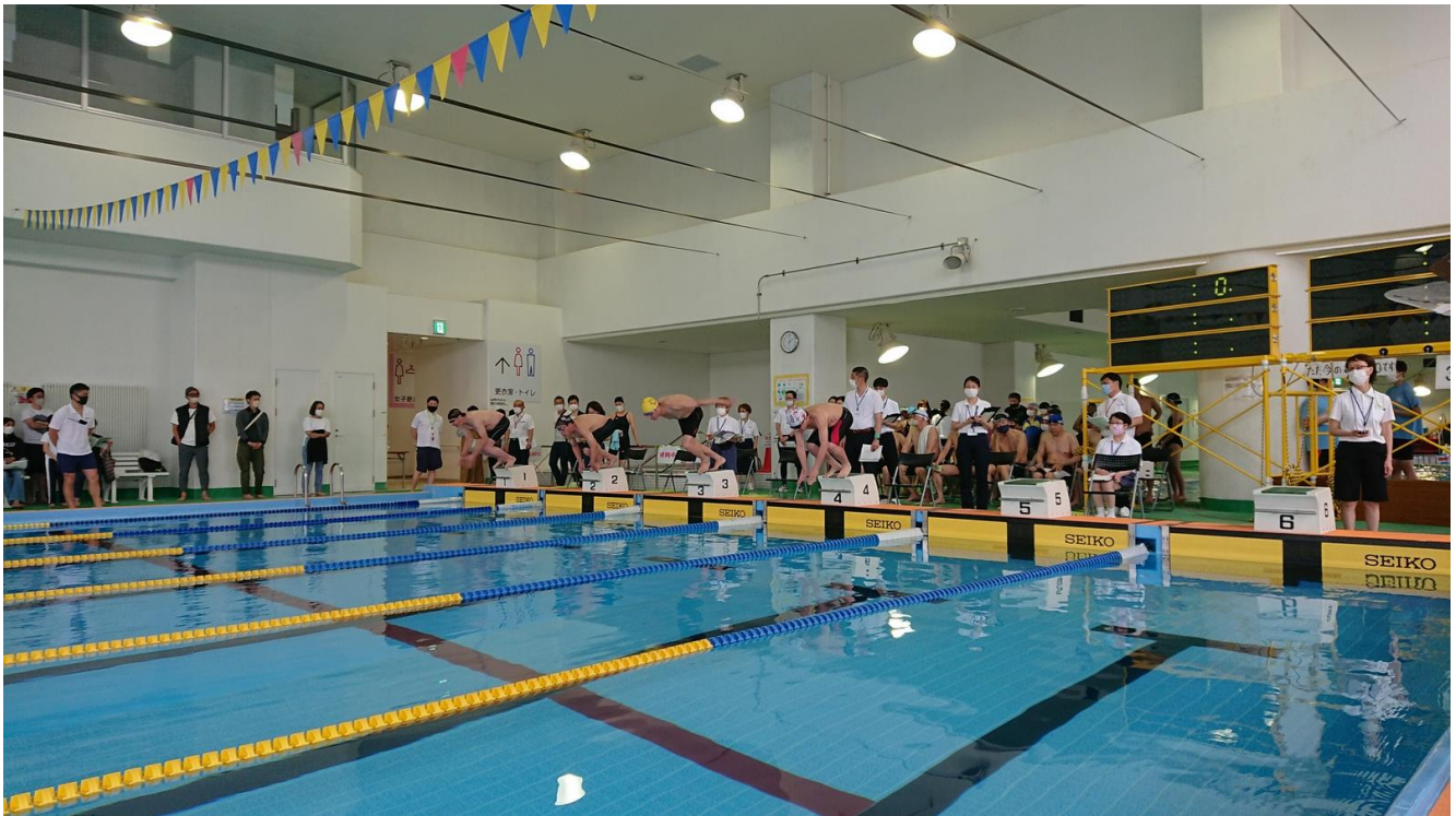
2022 杉並区ジュニア・マスタース大会

「コロナ感染対策」の制約の中でも、選手・関係者の皆さんの熱気が伝わってきます。於 高井戸温水プール