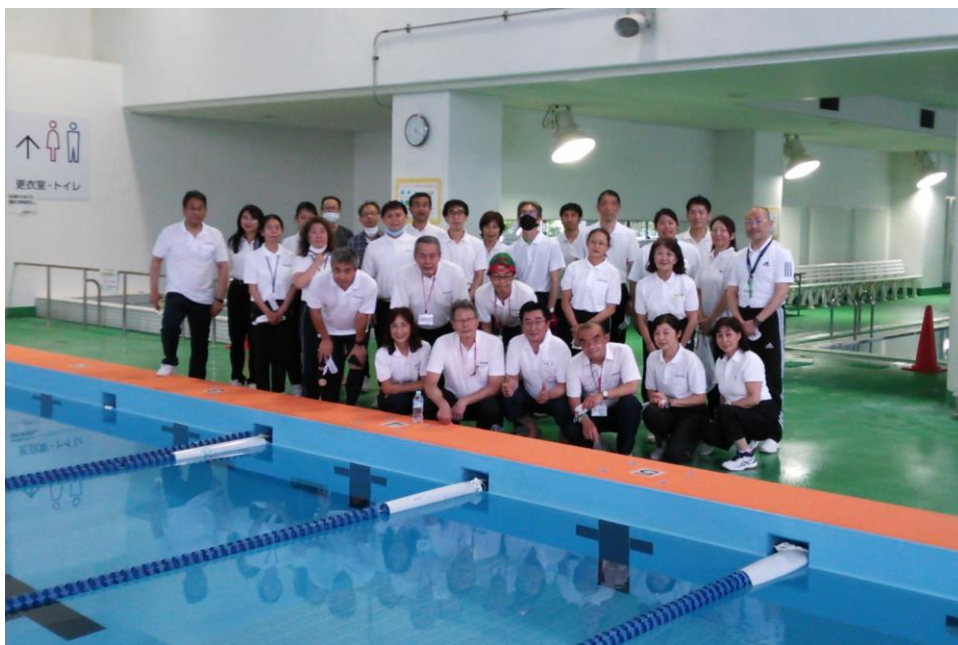
2022 ジュニア・マスターズ大会 競技役員の皆さん 高井戸温水プール

競技役員も密を避けるため会場の人数を減らしましたので、マスク袋を用意したり、今までにはない気配りが必要でした。選手達もやっと競技の場があるということで1人1人自分の競技が終了した後は、閉会式がありませんでしたので、帰っていききました。それでも、最高記録も更新され、リレーもできて良かったです。コロナ感染者は2月6日のピーク時で20,679人、5月15日は3,348人で減ってきています。