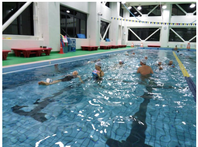
指導員実技研修会の様子 高井戸温水プール

●当選ハガキ、筆記用具、水着・水泳帽子(前面に大きく「姓」を記入してください。)