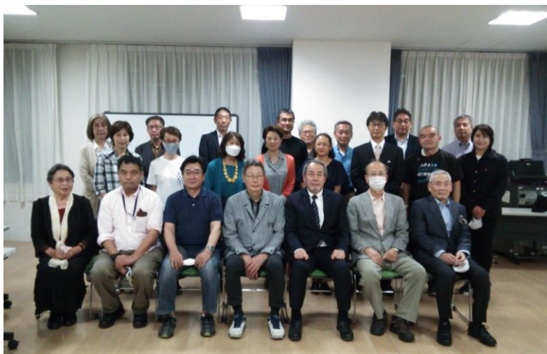
4月23日(土) 於：高井戸地域区民センター