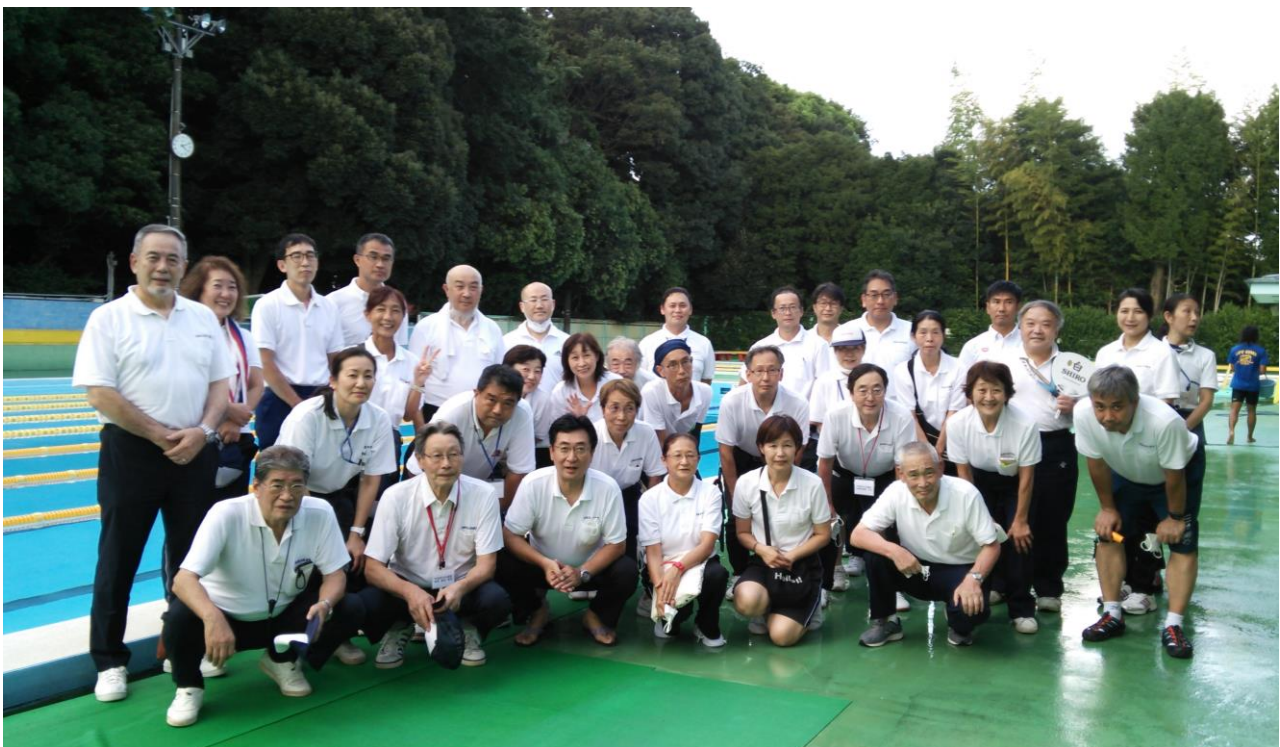
第75回 杉並区区民体育祭・夏季大会水泳競技会 競技役員の皆さん 於：和田堀公園プール 9月5日(日)