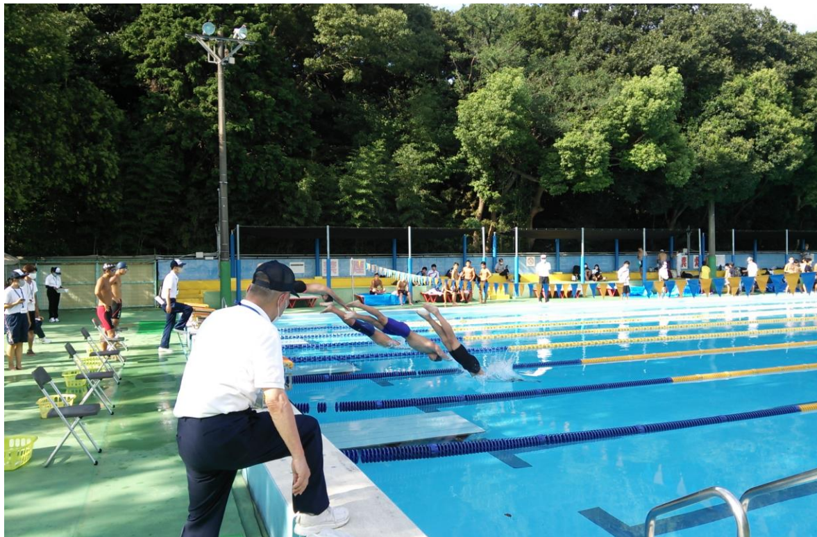
第75回 杉並区区民体育祭・夏季大会水泳競技会 和田堀公園プール（3頁に記事）