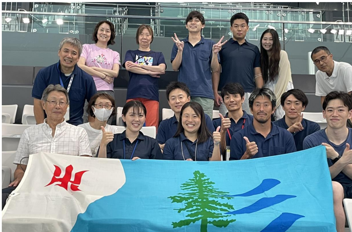
第77回 都民体育大会 水泳競技会 7月17日(月・祝) 杉並区選手、応援団の皆さん。 於 東京アクアティクスセンター(辰巳)