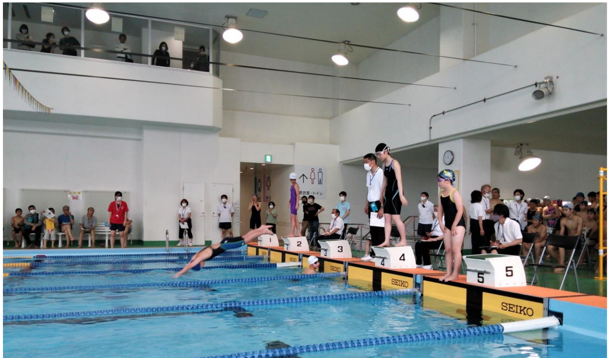
2023 ジュニア・マスターズ大会 高井戸温水プール

選手の皆さん、応援する家族、関係者の方々、水泳競技会の盛り上がりが徐々にもどりつつあることを感じられる大会でした。今後は、より誰でも参加できる大会になるよう、例えば、男女混合リレーや、水中デモンストレーション等々。工夫したメニューを考えたいと思っています。（競技部）